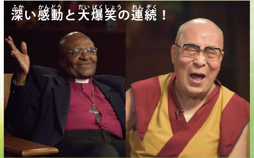
2021年/アメリカ/90分/英語（日本語字幕）