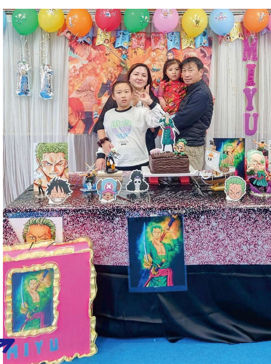
飾り付けのテーマはアニメのONE PIECE! ピニャタ

Dayアリーズは、YICメンバーの思い出を積み重ねた日記のようなものです。日常で起こった面白いことや旅先での忘れられない場所、出会いなど、YICメンバーが心に残った写真とエピソードを紹介するコーナーです。